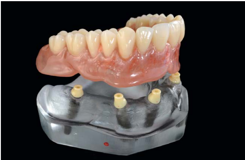
Afbeelding 2: Prothetisch werk gebruikmakend van cara YantaLoc® in combinatie met Pala® elementen en Pala cre-active®.

(Afbeeldingen akkoord voor gebruik in offline en online media)